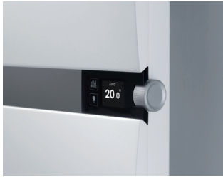
Commande digitale avec affichage de l'heure et de la température